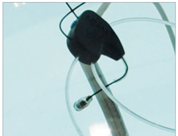
Zeitsparend, komfortabel und äußerst Präzise: Das längenvariable Gehörgangs-Mikrofon mit hygienischer Kunststoffumkapselung und auswechselbarem HF4-Filter der INSITU AS 04.