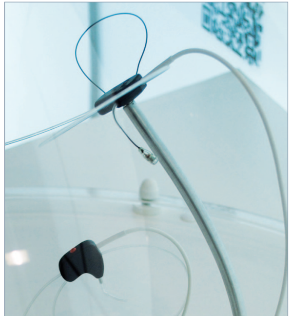
Unsere binauralen Schnellstartsonden mit patentierter Halteschleufe: INSITU AS 04 für die schlauchfreie In-Situ-Messung über Gehörgangs-Mikrofon (in Abb. 1 oben auf Präsentationsständer) und Vorgängermodell INSITU AS 03 (in Abb. 1 unten).