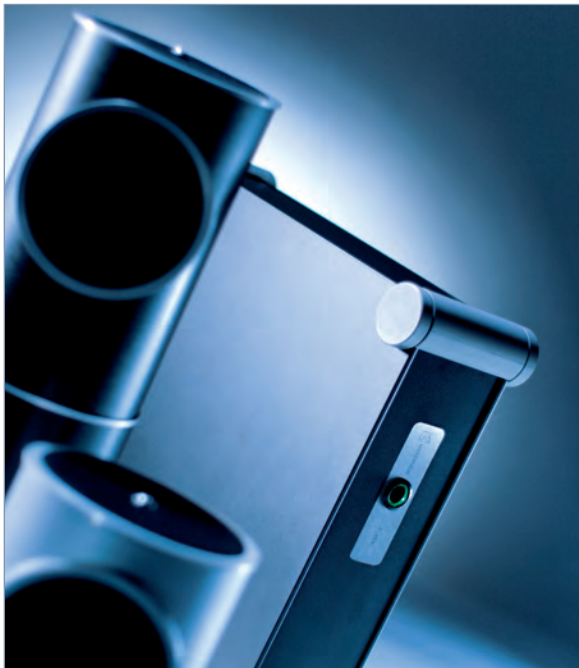
Abbildung oben: Harald Bonsel (links) und Mitarbeiter Karl Kotteé (rechts) in den späten 1980ern beim „Tüfteln“. Abbildung unten: Raumklangsystem Perfect-Sound-Field PSF-2 und modulare Designlautsprecher dB-99 aus heutigen Tagen.