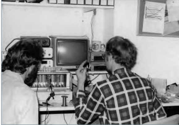
Von den Acousticon-Anfängen bis heute hat sich viel getan. Geblieben ist die ungebremste Innovationsfreude.